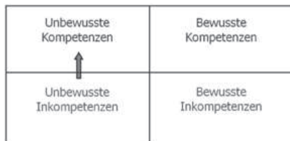
Abbildung: spontaner Lernprozess

Häufig findet auch spontanes Lernen statt. Es fällt uns gar nicht auf, dass wir einen wesentlichen Lernschritt bewältigt haben. Das neue Können ist einfach da.