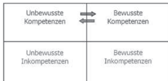
Abbildung: aus Erfolgen lernen

Aus Erfolgen können wir noch mehr lernen als aus Fehlern und Niederlagen